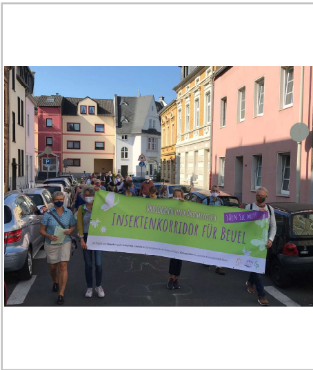
Marsch zum Einsäen von Pflanzstellen vor evangelischen und katholischen Kirchen