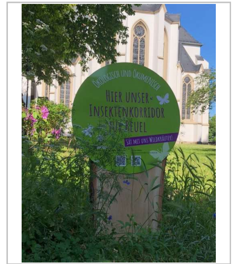
Aufsteller an den Orten mit Saatgut