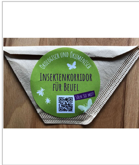
Saatguttütchen für den heimischen Balkon/Garten für Unterstützer und Kita-Kinder